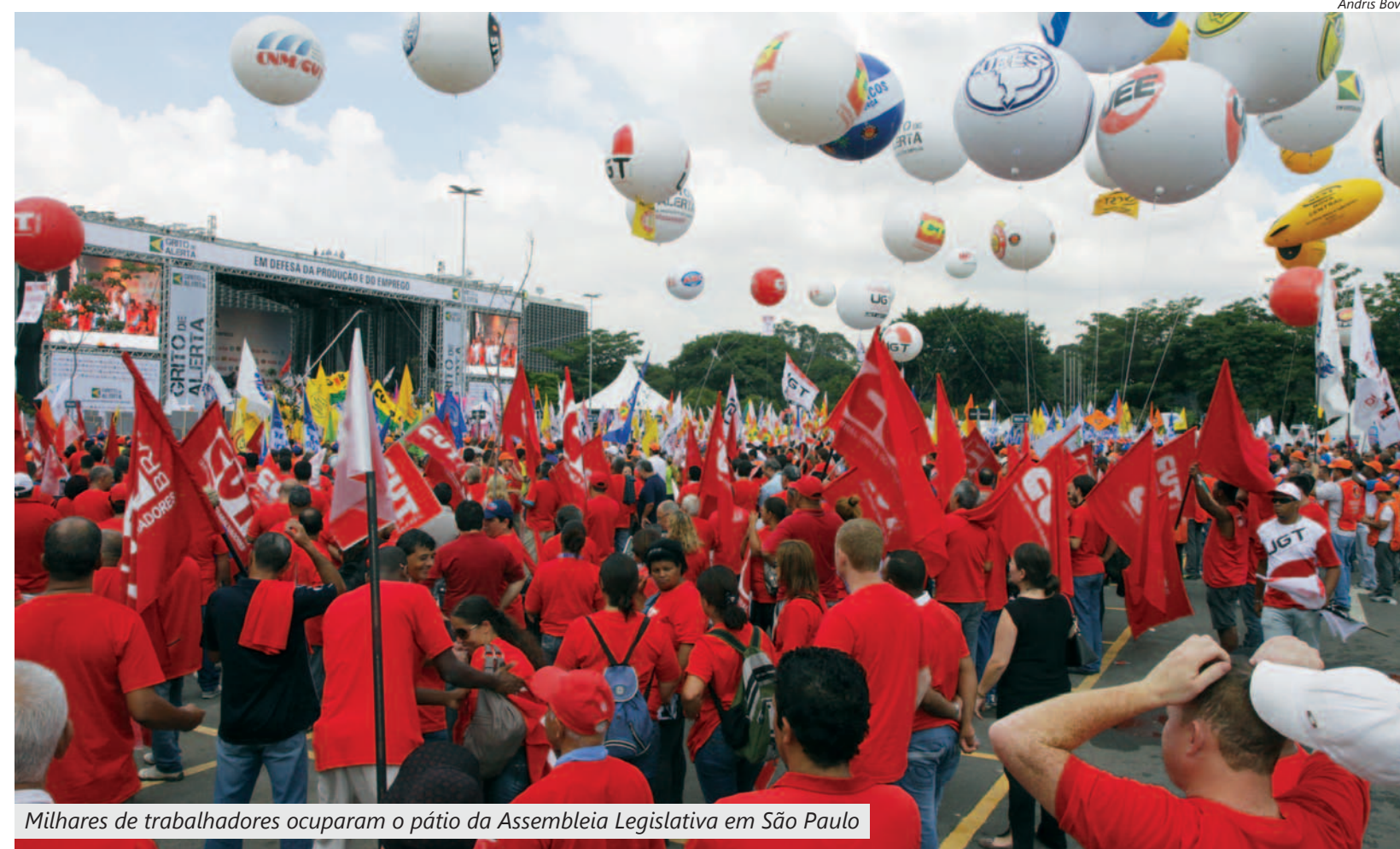
Milhares de trabalhadores ocuparam o pátio da Assembleia Legislativa em São Paulo

Ele também disse que quer manter aliança com os empresários que têm compromisso com o Brasil. “Para alguns patrões tanto faz produzir no Brasil ou no México, nos Estados Unidos ou na China. Eles não têm pátria. Esse tipo não nos interessa”, concluiu.