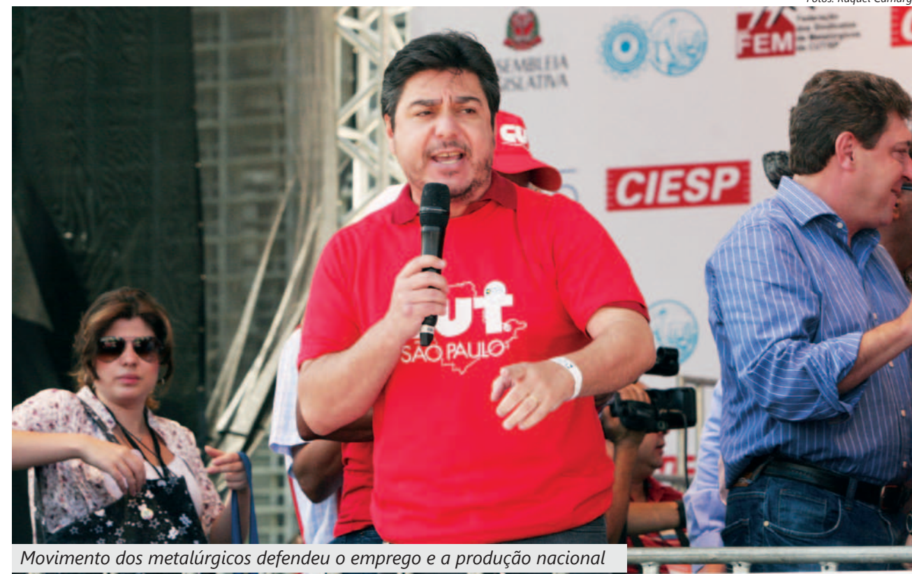
Movimento dos metalúrgicos defendeu o emprego e a produção nacional

“Desde então estamos atentos às circunstâncias do mercado, como quedas na produção. Por isso, as